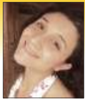
Lívia Lana Engenharia Ambiental

Os primeiros momentos em Viçosa são assim: será aqui a cidade de Minas, com uma das melhores universidades do país? Não quero ficar! Já os últimos momentos de formador: por que me formei rápido? Não quero ir embora! Chegamos em busca de uma boa formação, partimos agora com a certeza de um futuro brilhante. Enfim formados na UFV e na escola da vida. Valeu Viçosa! Vou-me indo, mas te levo no coração.