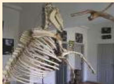
Esqueleto de animal em exposição no museu