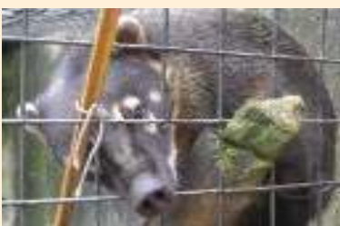
Os animais recebem tratamentos adequados no Cetas