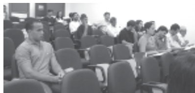
Público que prestigiou a realização da Oficina