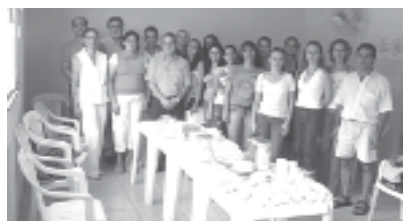
A degustação dos produtos marcou o encerramento do curso

As linhas de pesquisa, a serem objeto das dissertações dos mestrandos, serão: Conservação de Solos e Água; Drenagem e Movimento de Água e Solutos no Solo; Engenharia e Manejo da