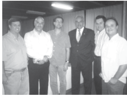
O presidente nacional da CBIC em reunião na UFV

Com o objetivo de fortalecer a representatividade do setor da construção nacional, responsável por 5,4% do Produto Interno Bruto (PIB) da economia e pela geração de 5,6 milhões de empregos no País, a Câmara Brasileira da Indústria da Construção (CBIC) iniciou uma série de visitas às cidades mineiras que possuem sindicatos empresariais da categoria.