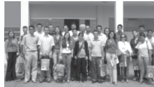
Parte do corpo docente e servidores técnico-administrativos do CRP