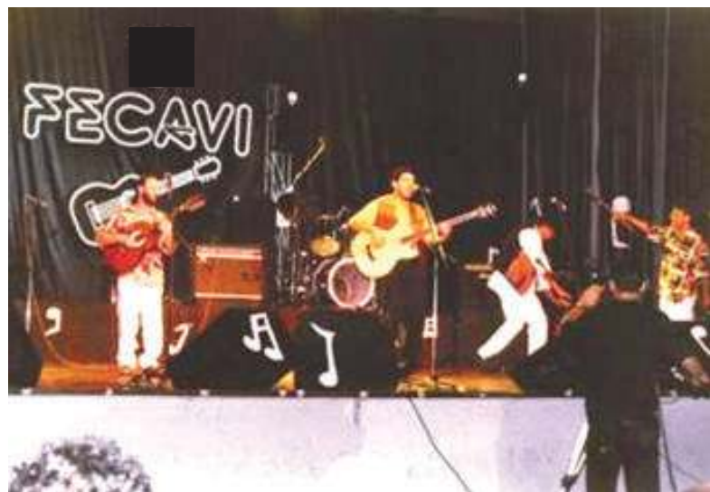
Espera-se que o 10º Fecavi tenha o mesmo sucesso das edições anteriores