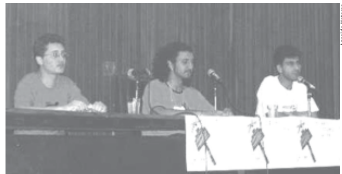
Representantes da UNE, UFRV e USP

Durante os quatro dias do congresso, oficinas, minicursos, grupos de trabalhos e apresentações culturais envolveram dezenas de estudantes para refletir