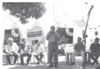
Os contadores de casos de Viçosa na 10ª edição do Café com Papo

A 10ª edição do Projeto "Café com Papo" iniciou a comemoração dos 136 anos da cidade de Viçosa, que serão celebrados amanhã, com programação organizada pela Secretaria Municipal de Cultura. O "Café" foi realizado no sábado, dia 22, na Praça Silviano Brandão. O evento apresentou contadores de casos que lembraram histórias marcadas na cidade e a Pequena Orquestra Ararita, que tocou música brasileira de percussão.