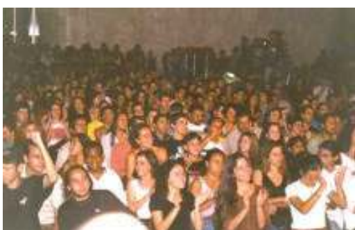
O evento sempre recebeu um grande público