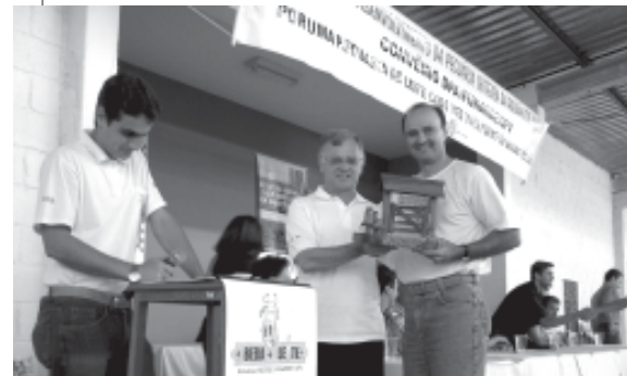
Cerimônia de premiação