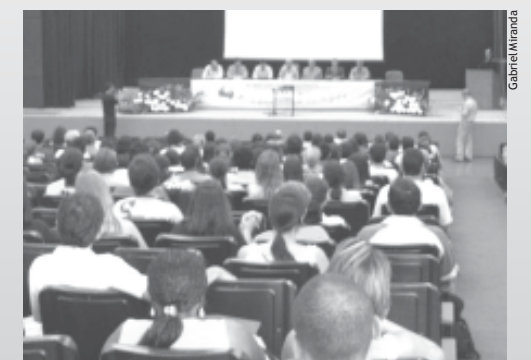
Parte do público que prestigiou o evento