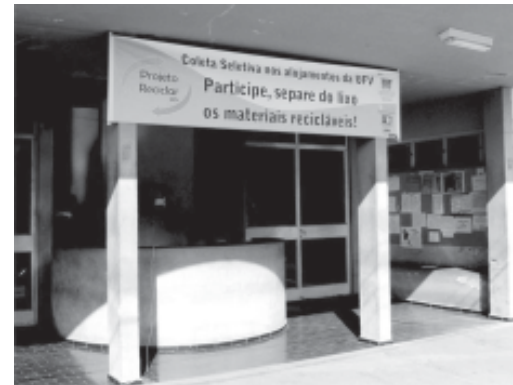
Faixa do projeto no alojamento Novíssimo

O Projeto Reciclar iniciou durante o mês de setembro a campanha de mobilização dos moradores dos alojamentos Novo e Novíssimo, convidando-os a realizar a coleta seletiva de materiais nos apartamentos. Cada morador poderá contribuir separando os materiais em recicláveis e orgânicos, depositando-os em tambores apropriados, para posterior triagem no Galpão do Projeto Reciclar/Asben.